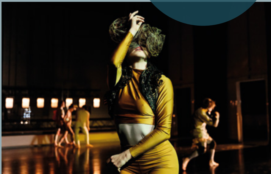
„Neuer Neuer Neuer Tanz“ von Michiel Vandeveld