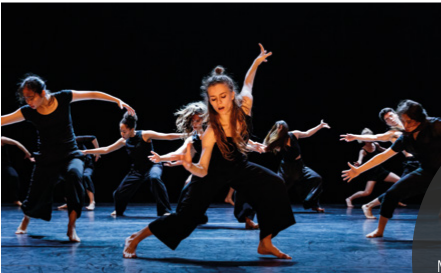
„This horse you cannot ride“ von Julio César Iglesias Ungo