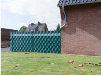
Michael Paul Romstöck Vorgarten nach Tornado, Viersen aus der Serie Hochs und Tiefs , 2018