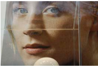
Bahram Shabani Bild Nummer 3 aus der Serie Marie , 2018